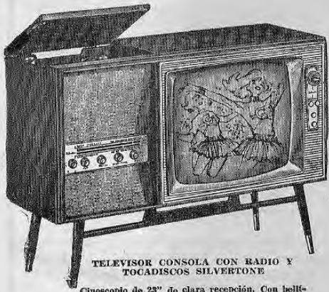
TELEVISOR CONSOLA CON RADIO Y TOCADISCOS SILVERTONE

Cinescopio de 23" de clara recepción. Con bellísimo mueble en color nogal. ESTEREOFONICA con tocadiscos totalmente automático de cuatro velocidades.