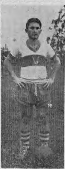
do el puesto de alero izquierdo. La gráfica que publicamos nos permite verlo con el uniforme de dicha selección. Toma parte en casi todas las

En 1961 viajó a Brasil para comenzar su carrera de Veterinaria.