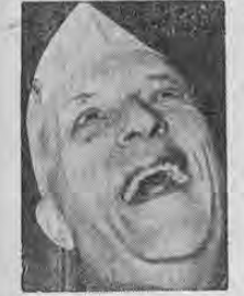
PRIMER MINISTRO DE LA INDIA NEHRU.

NEWVA DELHI, 28. AP.— El primer ministro Nehru logró hoy su reelección al Parlamento, siendo al parecer seguro que su partido del Congreso continuará su gobierno de la India, que ya lleva 15 años.