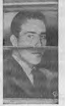
ANTHONY ARMSTRONG JONES

LONDRES, 28. AP.— La Princesa Margarita, hoy viuda de su marido, el ex fotógrafo Antony Armstrong Jones, ocupará su lugar como Conde de Snowdon en la Cámara de los Lores británica.