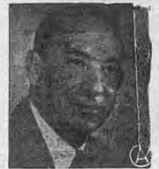
ORLICH ... Castro y la miseria...

CARACAS, 28. AP.—El presidente electo de Costa Rica Francisco Orlich dijo contestando a preguntas de la prensa que "son igualmente peligrosos la miseria y Fidel Castro". Apoyó seguidamente la idea expresada por el presidente Betancourt de excluir de la Organización de Estados Americanos a otras tres dictaduras americanas. Aunque el presidente Betancourt no las citó en su proposición se entiende que alude a Haití, Paraguay y Nicaragua.